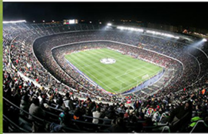
Raphaël au FC Barcelone !