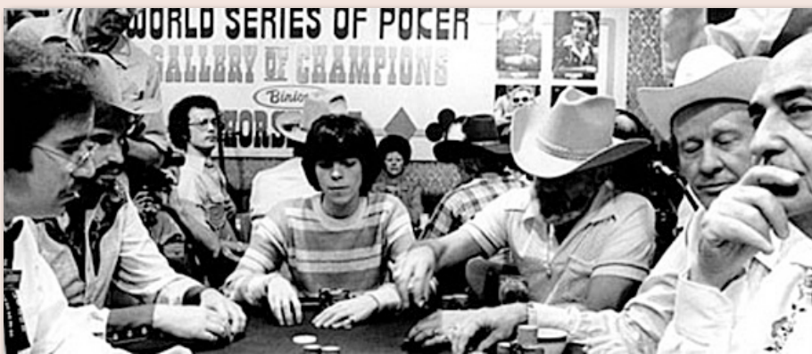
Un ange parmi les Rounders...

Personne n'étant dorénavant assez suicidaire pour jouer au gin-rummy avec lui, le Kid se lance dans le Black Jack . Compter jusqu'à 21 et mémoriser un jeu de 52 cartes allaient se révéler d'une telle facilité pour le phénomène que les casinos prirent rapidement la décision de généraliser les sabots comprenant six jeux. Précaution légitime mais totalement inutile !