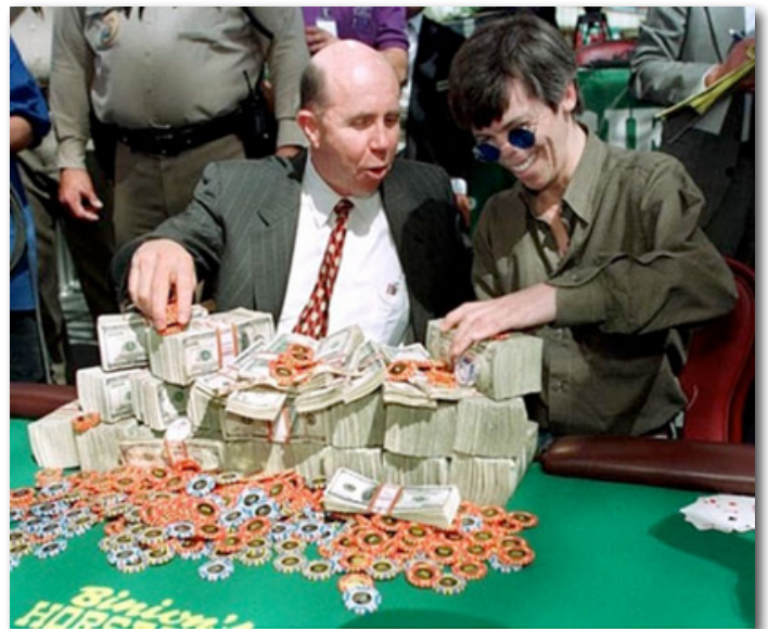
Troisième main event remporté par le Kid en 1997

Intronisé au Poker hall of Fame en 2001, son étoile brille au-dessus de toutes les tables de poker. Pour l'éternité.