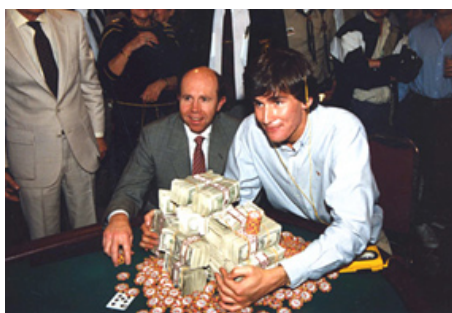
Et Hellmuth réussit l'impensable...

Le jeune Hellmuth n'a que 24 ans et quelques lignes à son palmarès, alors que son prestigieux adversaire est une légende qui a remporté une pléthore de bracelets et semble imbattable. Le tournoi de Chan a été une marche triomphale jusqu'à l'ultime duel entre les deux adversaires, il a éliminé presque tous les joueurs et se présente avec une large avance en jetons. Pourtant Phil Hellmuth va réussir l'impensable, dominer, mystifier l'immense Chan et devenir à l'époque le plus jeune champion du monde de l'histoire ! Les rares images de l'époque sont révélatrices, alors que personne n'aurait misé un dollar sur cet inconnu, le jeune américain semble d'une décontraction incroyable. Opposé à une légende vivante, la sérénité et la confiance en soi qui émanent de lui sont perceptibles. Phil Hellmuth est déjà persuadé d'être le meilleur et que son nom est destiné à être gravé dans l'histoire du poker !