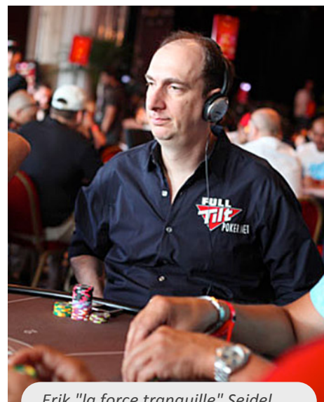
Erik "la force tranquille" Seidel...

Malgré ces innombrables performances et une qualité de jeu louée par les plus grands, Erik Seidel restait dans l'ombre des Ivey, Negreanu et autres Hellmuth. Il aura fallu ce premier semestre 2011 totalement insensé pour que soudain le monde du poker accorde au joueur toute la considération méritée. Avec 5 590 000$ gagnés en cinq mois et des succès de prestige, notamment le NBC National Heads Up l'épreuve que tous les professionnels rêvent de remporter tant elle constitue la reconnaissance d'une carrière, Seidel occupe pour la première fois le devant de la scène ! Il a dépassé Daniel Negreanu et Phil Ivey au classement de la All Time Money List. Obnubilés par leur duel, aucun des deux n'a vu l'ombre naissante du futur géant se profiler derrière eux avant de les dépasser dans un sprint imparable.