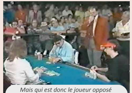
Mais qui est donc le joueur opposé à Erik Seidel ?

Rien ne prédisposait Erik Seidel à devenir une icône du poker, au contraire il avait tout du (sympathique) loser avec une première apparition en tournoi certes remarquable (deuxième du Main Event ) mais qui l'avait relégué dans un second rôle de perdant qui allait lui coller à la peau des années durant alors que Johnny Chan recevait les lauriers d'une gloire cinématographique éternelle. Avec un physique d'oiseau de proie dégingandé et un calme légendaire le rendant lisse, il n'avait rien pour déchaîner les passions.