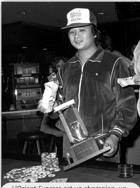
L'Orient Express est un champion, un vrai sportif qui joue en survêtement

Il réussit l'année suivante un exceptionnel doublé en s'imposant dans une finale légendaire contre Erik Seidel. Popularisée par le film culte "Rounders" la dernière scène est une ode au génie de Johnny Chan, Seidel n'est qu'un faire-valoir tout comme les autres finalistes avant lui, Humberto Brenes, TJ Cloutier, Jim Betchel, réduits aux rôles de figurants. Des légendes du poker avaient déjà réussi un doublé consécutivement (NDLA, Johnny Moss, Doyle Brunson et Stu Ungar), mais à une époque lointaine lorsque le nombre d'inscrits était beaucoup plus faible. Chan a gagné son pari, il est devenu une légende à seulement 26 ans.