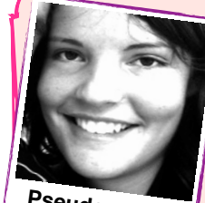
Pseudo : XoXo Prénom : Lorianne

Ton nickname au poker ? Une signification ?